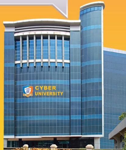
REKTORAT CYBER UNIVERSITY